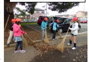
みんなで、落ち葉はき

冬休みは、年末の大掃除や正月準備また新年行事と家庭や地域で過ごすことが多くなります。またいろいろな方々と接する機会もたくさんあることでしょう。挨拶の仕方、目上の方達への言葉遣いなど、子どもたちの社会性を身につけるよい機会になると思っております。お子様の成長の様子を機敏に見取り、褒めてあげてください。また「お手伝い」も、家族の一員としての自覚と喜びを感じることに役立ちます。この冬休みの家庭生活の中で機会を捉えて育ててください。この一年間、皆様には多大なるご支援・ご協力を頂きましたことに深く感謝申し上げます。どうぞ良いお年をお迎えください。