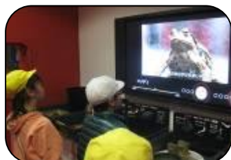
「カエルの鳴き声ってどんな感じだった？」