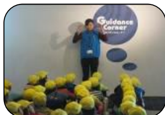
スタッフの方の説明を真剣に聴くおゆみっ子

21日(金)に4年生は路線バスに乗って千葉市科学館に行ってきました。目の錯覚を生かした不思議な部屋体験や今年リニューアルしたプラネタリウムで太陽・月・星の学習をしたり、映像に合わせて工夫した効果音を録音したりと、帰りの時間ぎりぎりまで体験学習を楽しみました。バスの中でも科学館でも、「よ・い・こ・さ」の決まりを守り、充実した体験活動ができました。