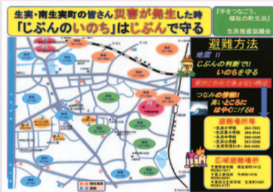
地区の避難所などを記載した防災マップ