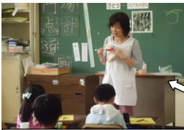
1本1本丁寧に磨きましょうね。

6月には、学校歯科医師さんのご指導をいただきながら、養護教諭が保健室から教室にとび出して、全学年学級を回って口腔衛生指導『正しい歯磨きのしかた』を行いました。赤く染め出された歯垢のあとを鏡に映し、覗き込むようにして熱心に歯ブラシを細かく動かし、丁寧に歯を磨くことができました。