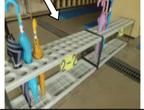
傘立も一人一枠、取り出し易く改良しました！