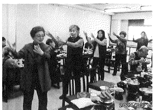
九十九里 太陽の里にて花見 花より団子

本年度の会員数は54名(男性21名、女性33名)、平均年齢83歳で出発しました。