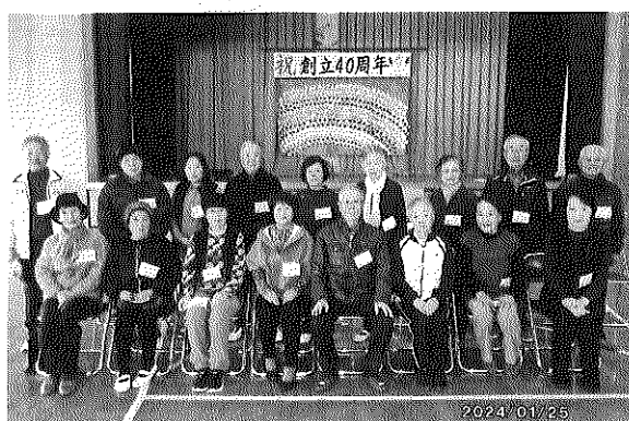
東小学校にて先生役として小1生徒に指導 けん玉、おはじき、お手玉等

主要な行事は体育関係のグラウンドゴルフ、ゲートボール、輪投げ、輪踊りを中心に行っております。上部団体である中央区老連、地区老連の大会にも常時参加して活発に活動しております。