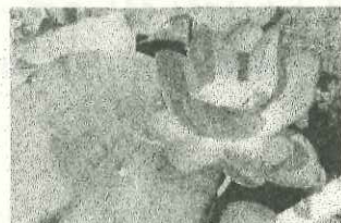
職員室前のオオガハス

千葉公園のオオガハスは今が見頃です。昨年度は直近5年間で一番の開花数でした。臨時駐車場の時間指定開放や木道の早朝開放も7月3日までです。ぜひご家族でお出掛けください。