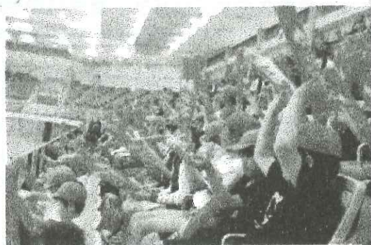
ポートアリーナでシッティングバレー応援