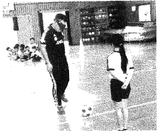
ブラインドサッカー体験学習

大会観戦チケットの申し込みも始まり、いよいよオリンピック機運も高まってきていますが、本校でも教育活動に様々なオリンピック・パラリンピック関連の催しを企画しています。既にお知らせをしましたが、4、5年生はポートアリーナで行われたシッティングバレーの国際大会を観戦しました。また4年生は、体育館でブラインドサッカー選手との交流授業を行いました。今後その他の学年でも、体育の授業等で競技の体験を予定しています。その他にもオリンピック・パラリンピックに関連した校内環境などを整えていく予定です。これらの催しは東京オリンピック・パラリンピックに子供たちが関心をもつことのほかに、様々な多様性を認める心を育てることを目的としています。