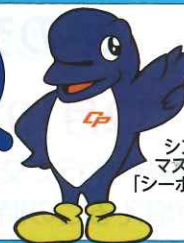
シンボルマスコット [シーボック]

発行者 千葉県警察本部 〒260-8668 千葉市中央区長洲1丁目9番1号 ☎043-201-0110