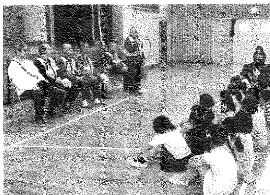
全校児童の前でセーフティウォッチャーさんの紹介

千葉市では、児童の登下校の見守りを地域・保護者の方にしていただくセーフティウォッチャー活動を平成17年度から実施しています。見守り活動はできる時で構いません。朝の掃除や犬の散歩などの時間を、児童の登下校の時刻に合わせていただければ、気軽に見守り活動をしていただけます。犯罪は人の目が多いことで、大きな抑止力となります。今月全家庭に登録申し込み用紙を配付します。また、地域の皆様には、お電話いただければお届けいたします。多くの方の登録をお待ちしています。